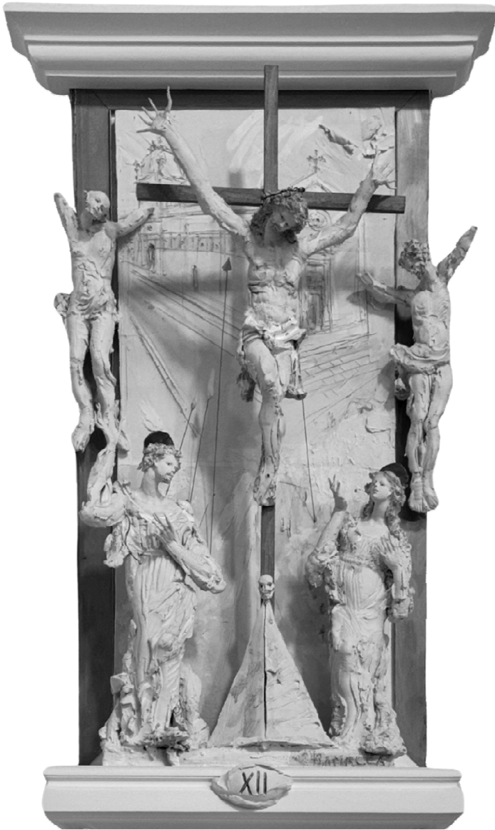
XII Stazione - Gesù muore in croce - RAMACCA