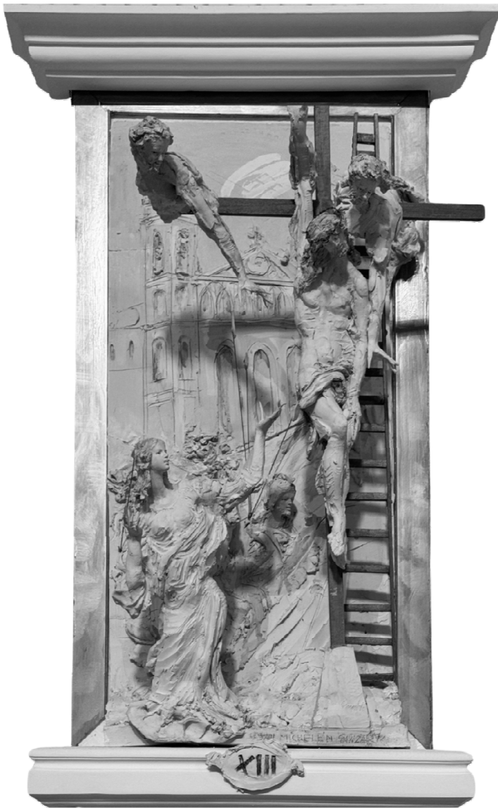
XIII Stazione - Gesù è deposto dalla croce - SAN MICHELE DI GANZARIA