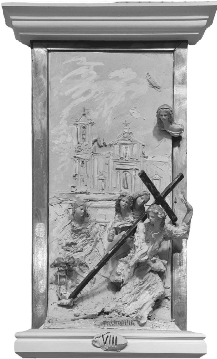
VIII Stazione - Gesù incontra le donne di Gerusalemme - PALAGONIA