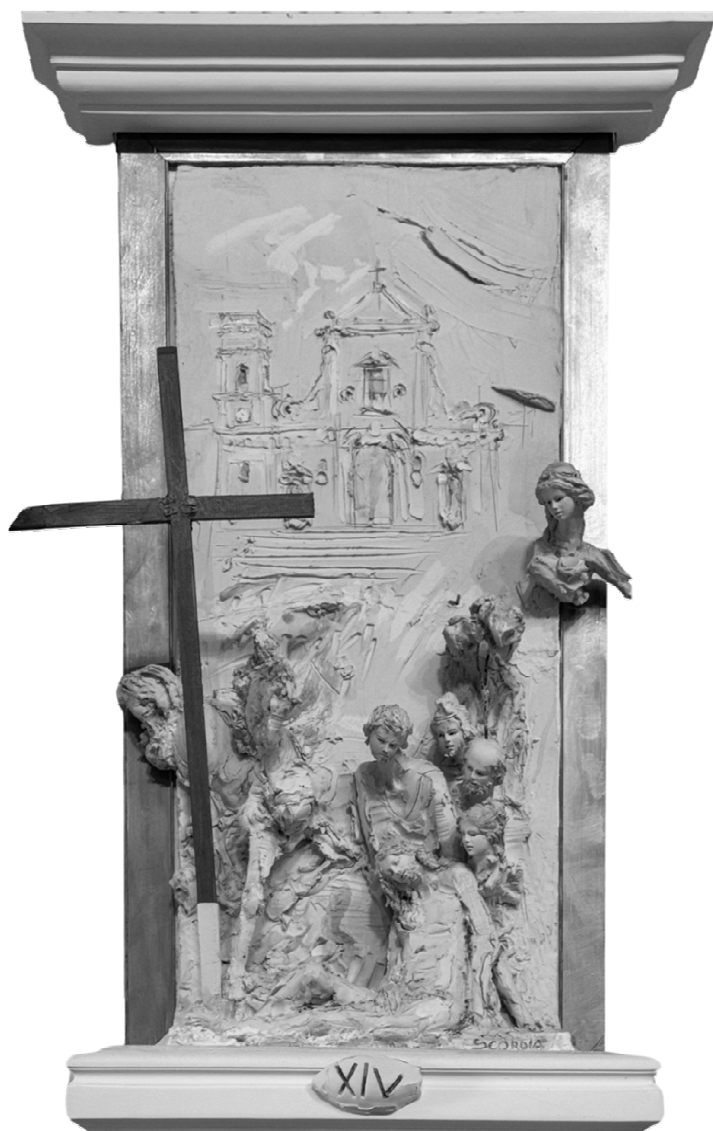
XIV Stazione - Gesù è deposto nel sepolcro - SCORDIA