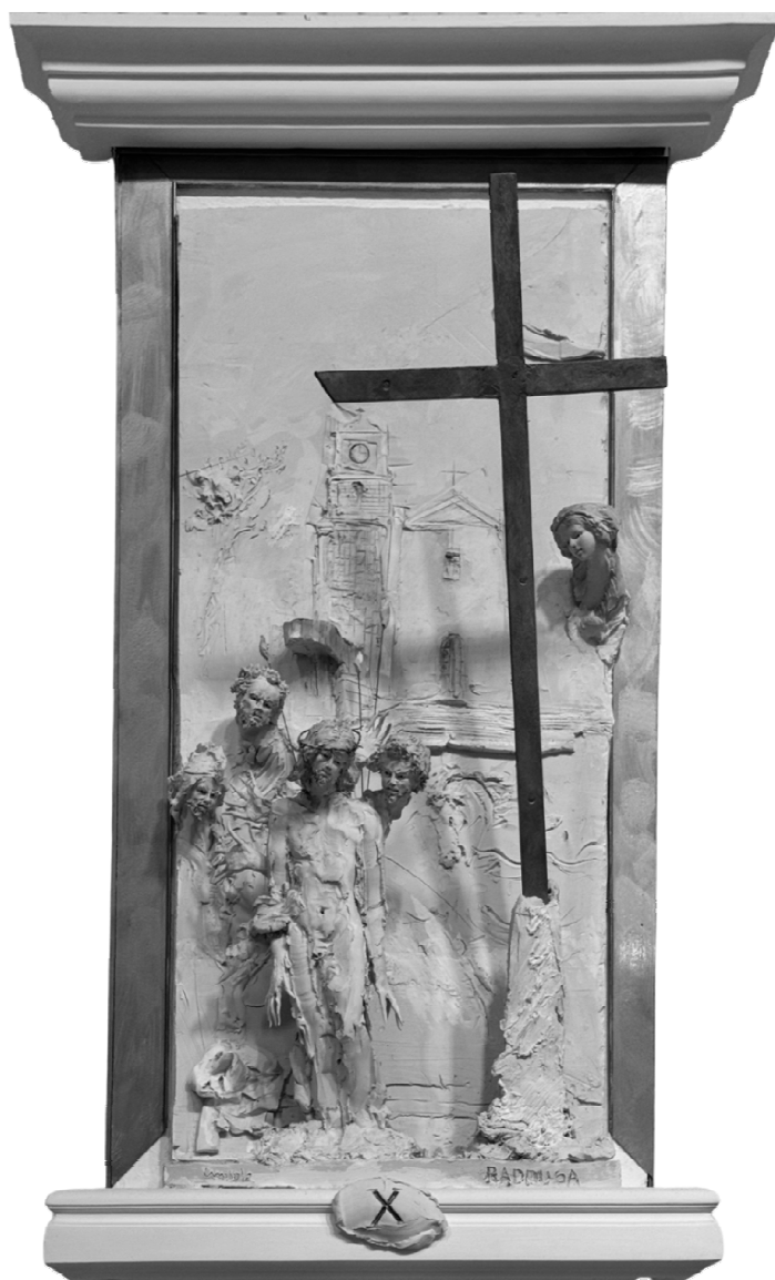
X Stazione - Gesù è spogliato delle sue vesti - RADDUSA