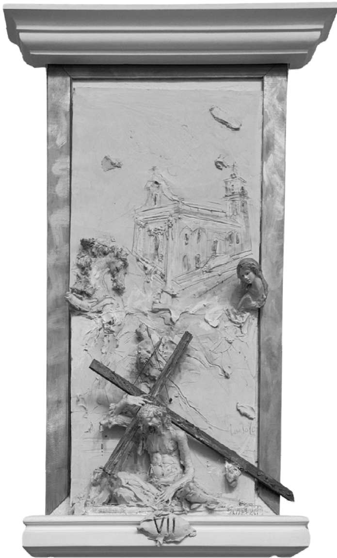
VII Stazione - Gesù cade per la seconda volta - VIZZINI