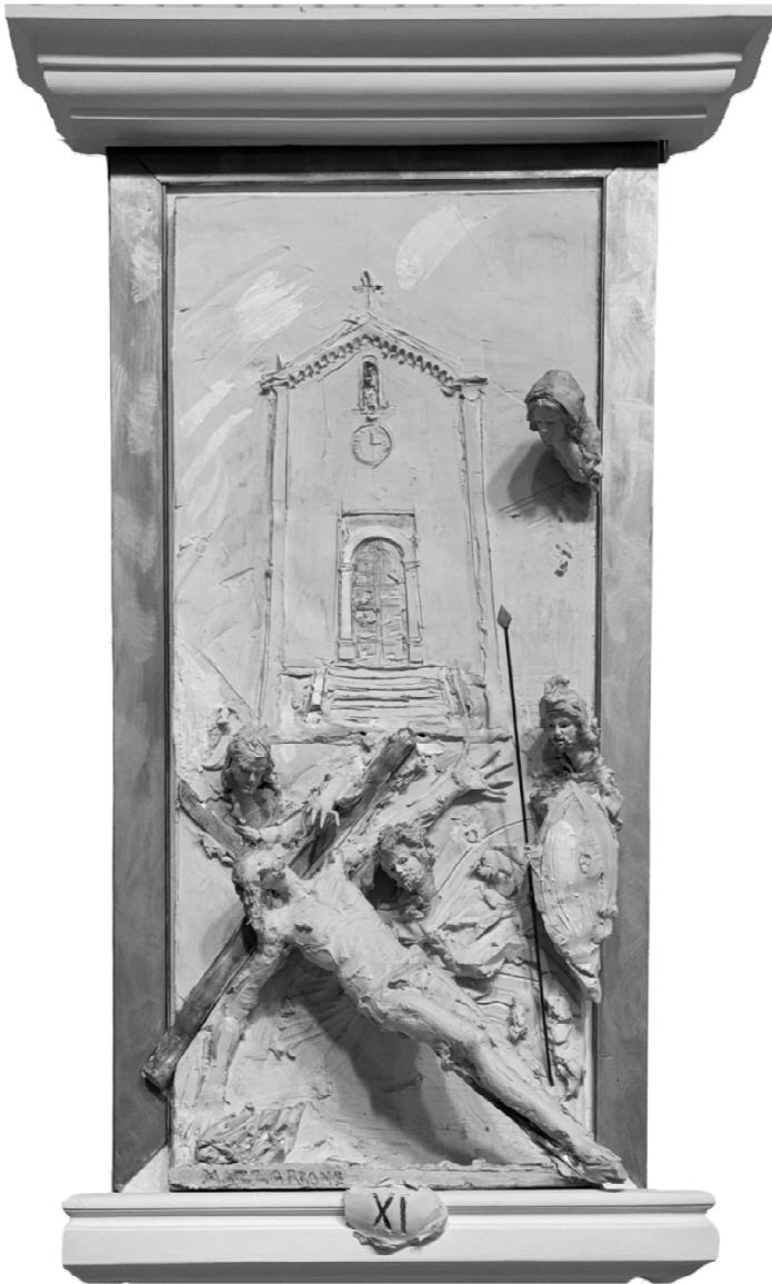
XI Stazione - Gesù è inchiodato sulla croce - MAZZARRONE