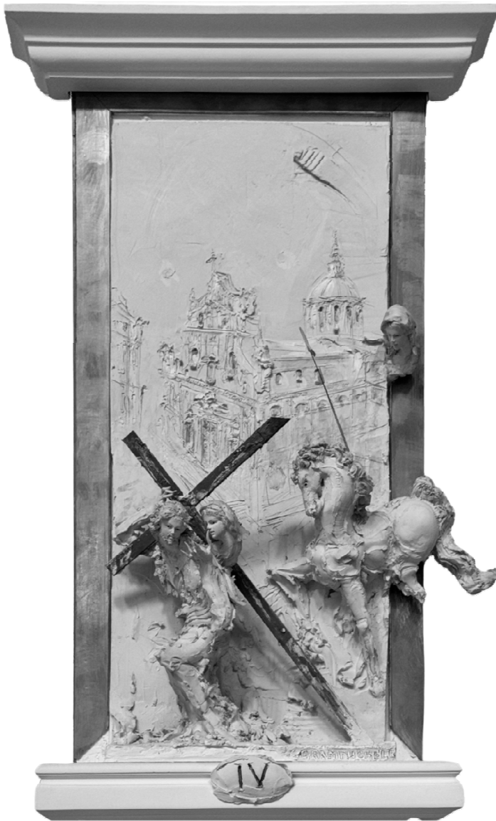
IV Stazione - Gesù incontra sua madre - GRAMMICHELE