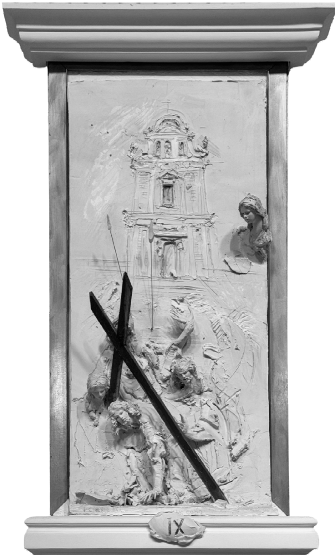
IX Stazione - Gesù cade per la terza volta - SAN CONO