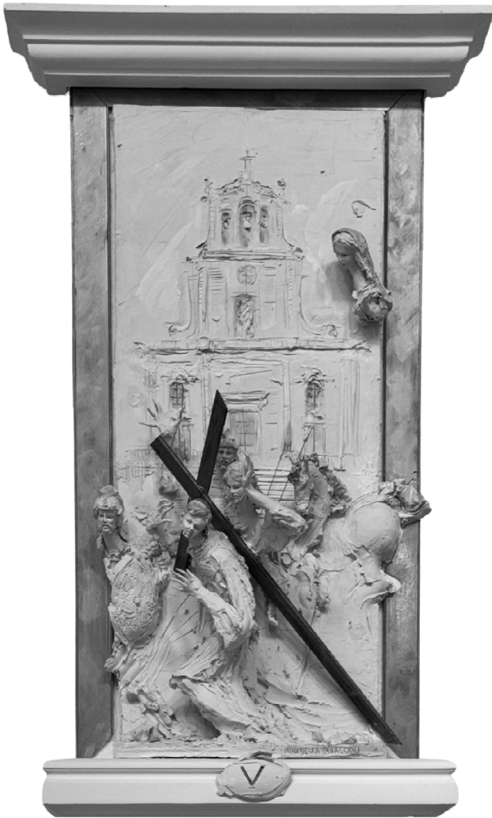
V Stazione - Gesù è aiutato dal Cireneo - MIRABELLA IMBACCARI