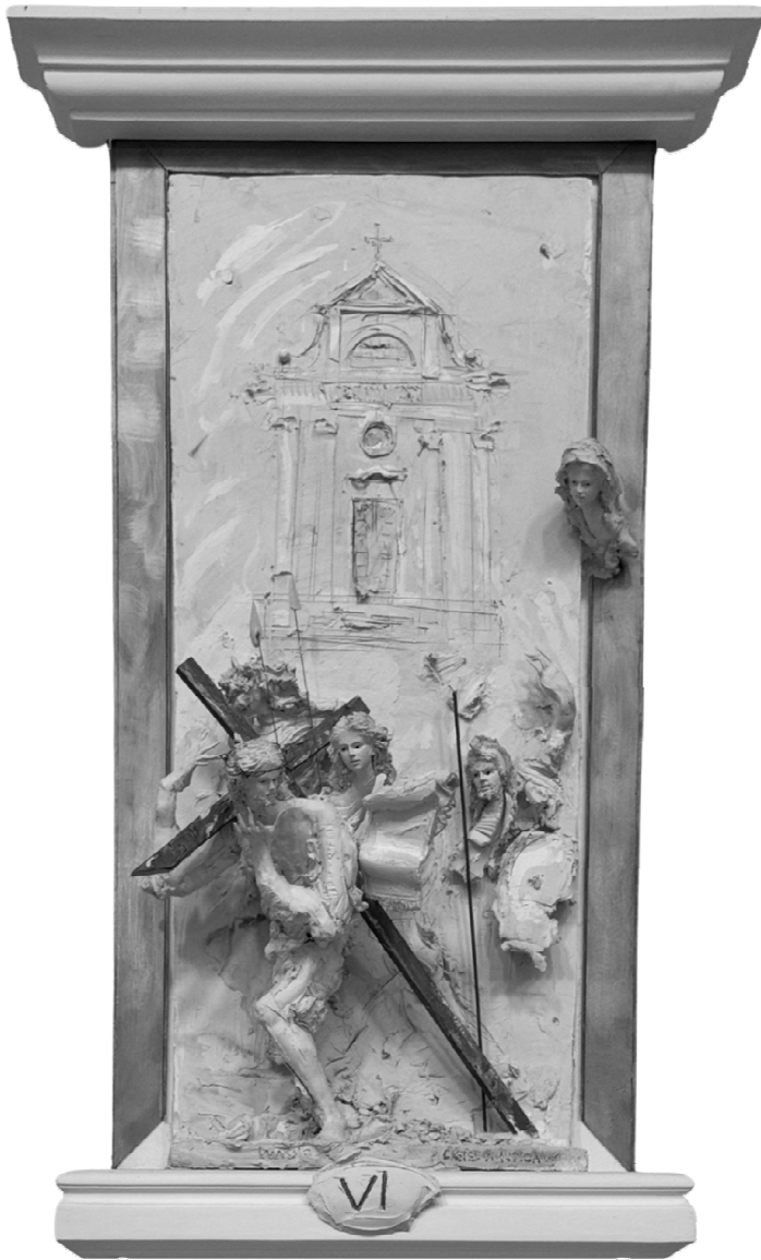
VI Stazione - Gesù incontra la Veronica - CASTEL DI IUDICA