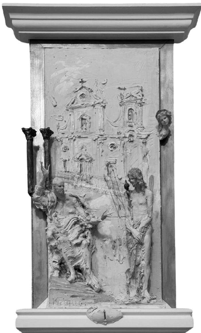
I Stazione - Gesù è condannato a morte - MILITELLO IN VAL DI CATANIA