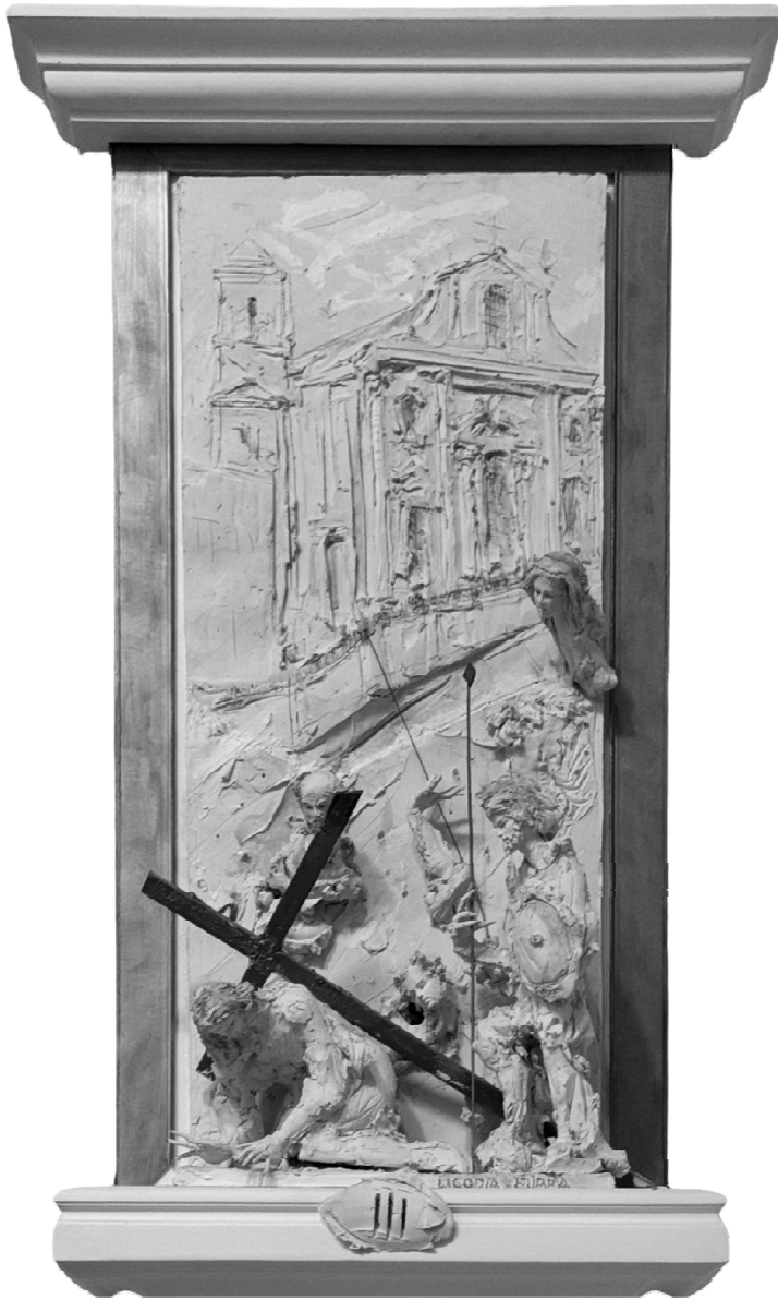
III Stazione - Gesù cade per la prima volta - LICODIA EUBEA