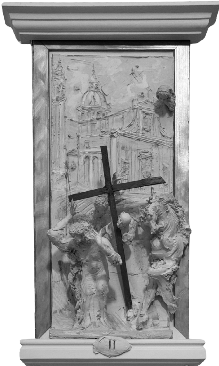
II Stazione - Gesù è caricato della croce - CALTAGIRONE