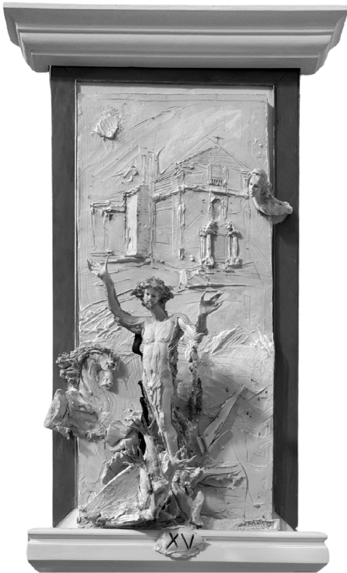
XV Stazione - Gesù risorge da morte - MINEO